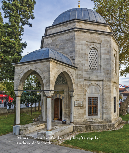
Mimar Sinan tarafından Beşiktaş'ta yapılan türbeye defnedildi.